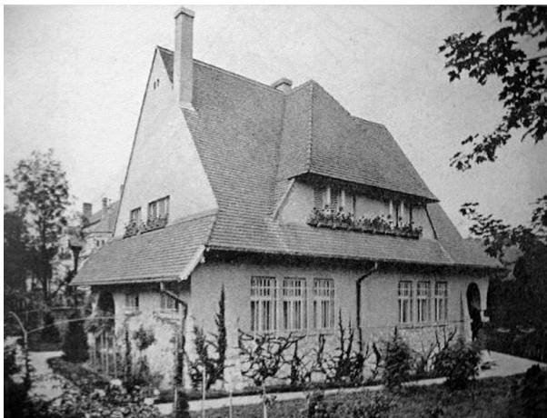
2. Herczeg villa: Herczeg Ferenc villája a Magyar Építőművészet 1913/8-as számában

Zrumeczky Herczeg Ferencnek tervezett nyaralójáról (Hűvösvölgyi út 87. 54 11164 hrsz.) nem áll rendelkezésünkre korabeli tervrajz. Az Új Idők 1914-es számában és a Magyar Építőművészet 1913. évfolyamának augusztusi számában találunk fotókat a házról. 55 Az épületet tervezésénél elsősorban a belső terek, a lakótér otthonos kialakítása játszott szerepet, hiszen a ház külső megjelenésén nagyon szembetűnő az