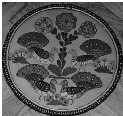
2. kép: Pávás falikorong. Miskolc, Herman Ottó Múzeum. Kerámia, tempera. D: 28. 1951.

(1. kép) Vannak kerámiák rovásjegyekkel, és vannak csak bekarcolt, festetlenül hagyott díszítéssel is.