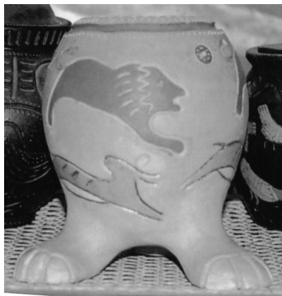
1. kép: Oroszlánmotívumos díszedény (a fedele elveszett). Miskolc, Herman Ottó Múzeum. Kerámia, tempera. M: 21,5. é.n.