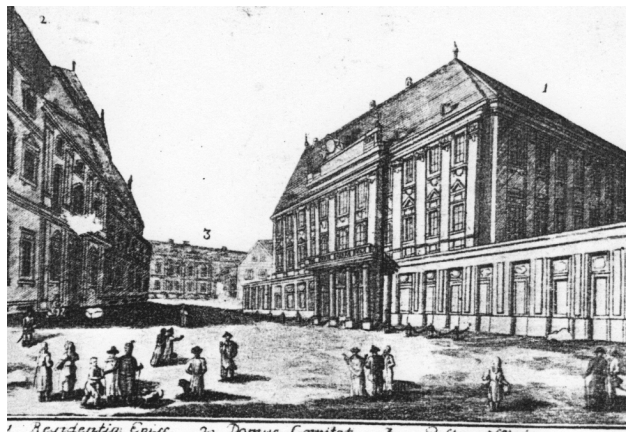
3. kép. Tischler Antal, A szombathelyi püspöki palota, (rézmetszet, 1791)

árkados fedett galériák funkciója ugyanis megszűnt.