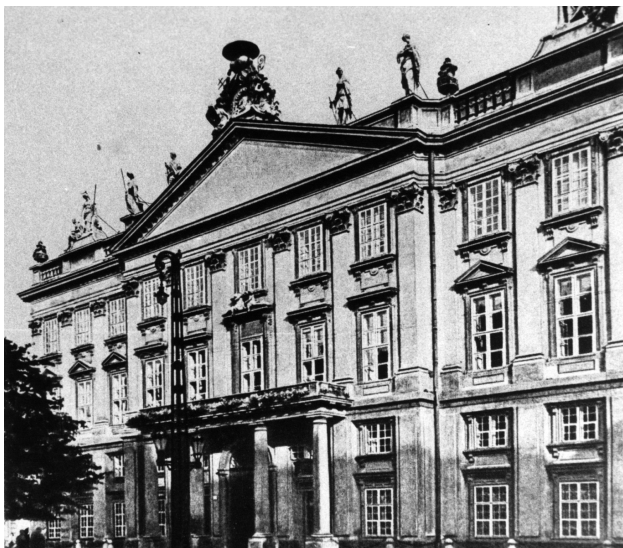
2. kép. A pozsonyi (Bratislava, SK) primási palota

A vártemplom lebontására csak 1791-ben került sor, vagyis „együttélése” a palotával közel tíz évig tartott. Szíly eleinte nem gondolt lebontására, mert a templom kibővítésére 1781-ben még tervet dolgoztatott ki építésével. 10 Valószínűleg a galériákat is ekkor bontották le, hogy a cour-d'honneur megnyissák. A földszintes