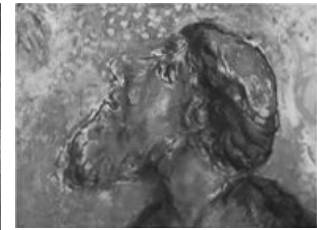
1. kép (balra). Ábrahám. Részlet: Chagall, Ábrahám és a három angyal , 1950–1955, olaj, vászon, 190 x 292 cm festményéről. Nice, Musée Message Biblique Marc Chagall