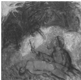
3. kép (balra fent). Chagall, Golgota , 1912, olaj, vászon, 174 x 191 cm, Museum of Modern Arts, New York